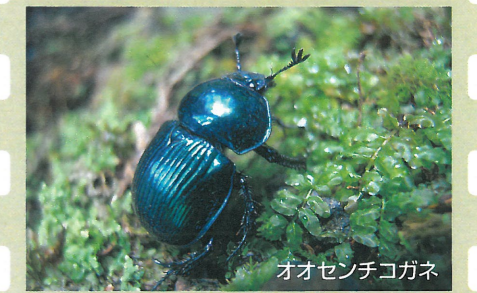
オオセンチコガネ