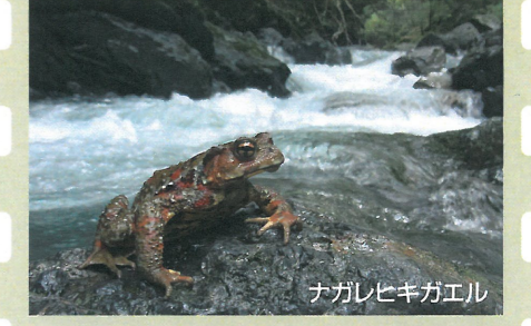
ナガレヒキガエル