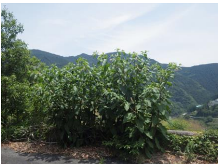
ヨウシュヤマゴボウ