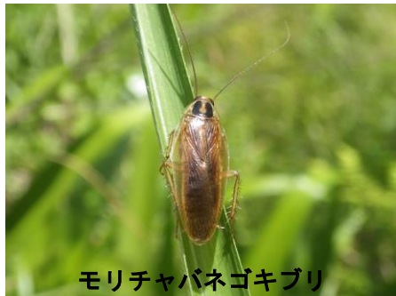
モリチャバネゴキブリ