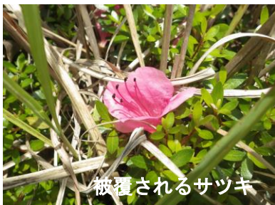
被覆されるサツキ