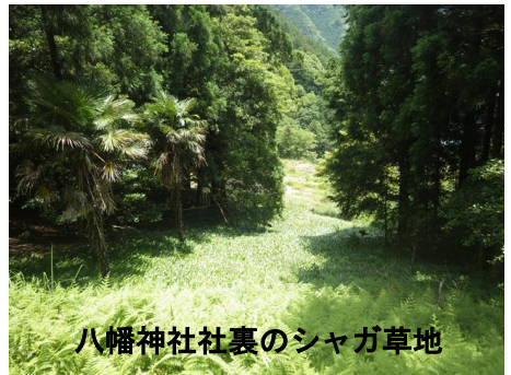
八幡神社社裏のシャガ草地