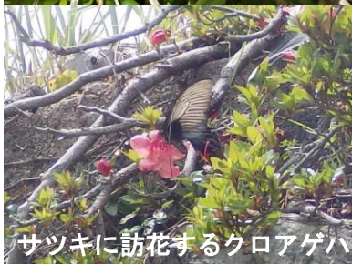
サツキに訪花するクロアゲハ