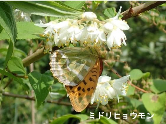
ミドリヒョウモン

前翅の付け根から先端までの長さ（前翅長）35-40mmのタテハチョウ科のチョウ。